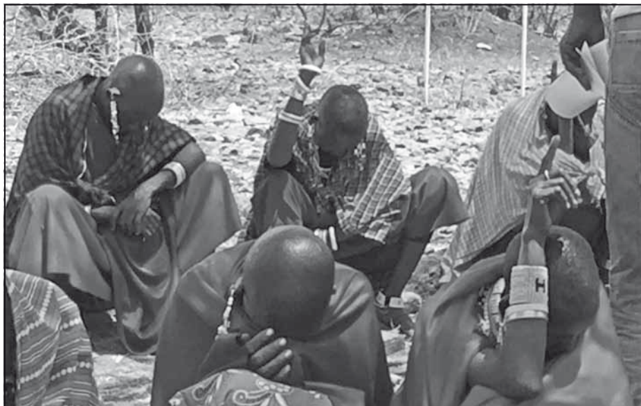
Masai-kvinderne lærer hemmelig afstemning

3,35 kr). Maximum 5 stempler kan indsættes på en uge.