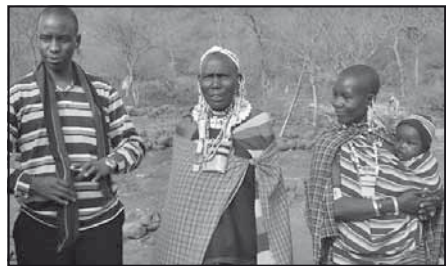
Wilson, Wilsons mor og Wilsons søster

De har anlagt en stor køkkenhave, som eleverne er med til at