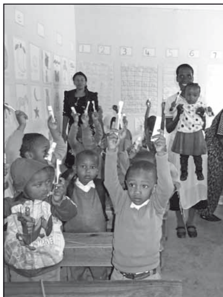
Elever på Teddys school får tandbørster

ses i syning, madlavning, IT og el. Vi så Soyamøllen og deres køkkenhave – da det var i den tørre periode, vi var der, var det begrænset, hvad der kunne høstes der.