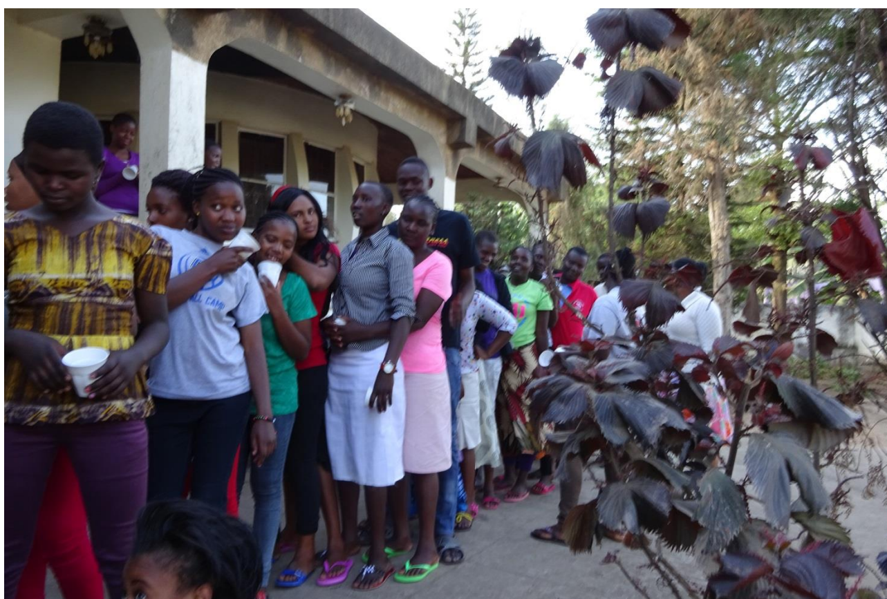
Elever på hostel (studiebolig)