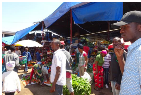
Marked i Arusha