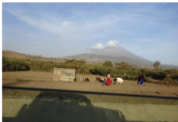
Mount Meru set fra vejen