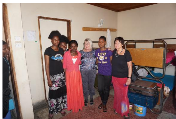
Vi besøger et pigeværelse på Hostel

Denne udtalelse har jeg hørt flere gange, men besluttede mig for, at få